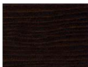
Noce scuro V33